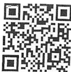
แผนที่ จุดนัดพบ