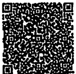
กำหนดการ