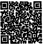
แบบตอบรับ

ผู้อำนวยการส่วนยุทธศาสตร์และพัฒนาระบบบริการสุขภาพ สำนักงานพัฒนาระบบบริการสุขภาพ สำนักงานแพทย์ ๑๗ มิ.ย. ๒๕๖๗