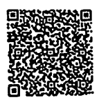
กำหนดการ